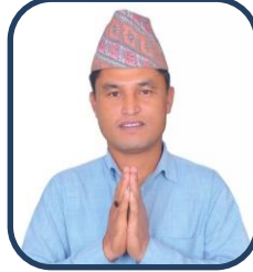
मा.झपट बहादुर साउँद सदस्य